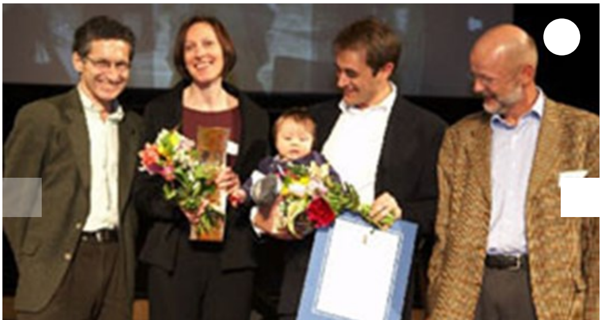
Das Siegerprojekt: "Connecting People" von der Asylkoordination